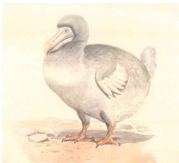
rys. Karol Łukaszewicz